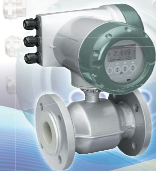
High performance EGM4300C